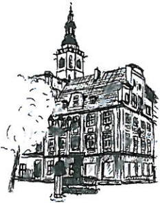
Rynek Wieża ratuszowa