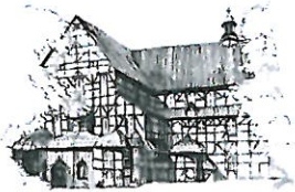
Kościół Pokoju pw. Św. Trójcy Wpisany na listę UNESCO